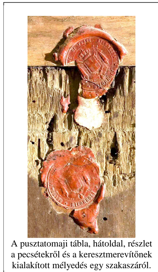
A pusztatomaji tábla, hátoldal, részlet a pecsétokról és a keresztmerezítőknek kialakított mélyedés egy szakaszáról.