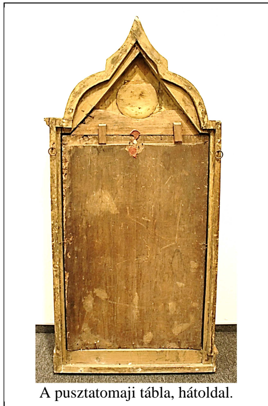
A pusztatomaji tábla, hátoldal.